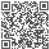
รายละเอียดงานอบรม