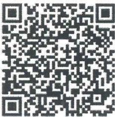
QR code ลงทะเบียน

จึงเรียนมาเพื่อโปรดพิจารณาให้ความอนุเคราะห์ และขอขอบพระคุณเป็นอย่างสูงมา ณ โอกาสนี้