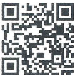
QR code โฟล်โปสเตอร์ประชาสัมพันธ์