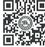
Modern Library: Challenge, Achievements, Ideas